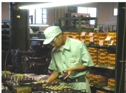
学校設定科目「キャリア実習」 地元企業での長期デュアルシステム (企業実習)の様子